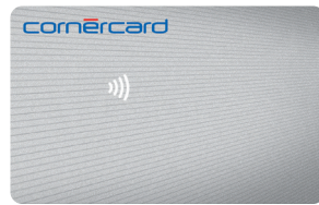
Cornèrcard Business Classic VISA mastercard