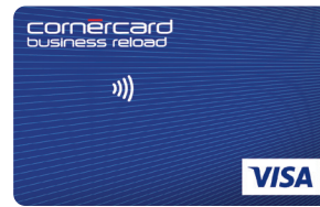
Cornèrcard Business Prepaid VISA