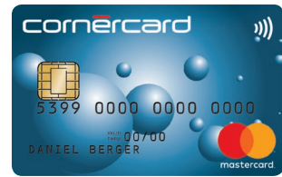
Cornercard Reload Blue Mastercard® 26/698/A60 PF: 26/703/A61

Important: toutes les données doivent être fournies pour que la carte puisse être émise et pour que toutes les prestations de la carte puissent être activées.