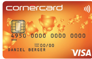
Cornercard Reload Orange Visa 06/698/A54 PF: 06/703/A55