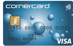
Cornercard Reload Blue Visa 06/698/A51 PF: 06/703/A52