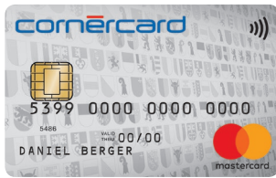
Cornercard Reload Silver Mastercard® 26/698/A58 PF: 26/703/A59