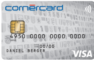
Cornercard Reload Silver Visa 06/698/A49 PF: 06/703/A50

Oui, je souhaite profiter des avantages Cornercard Reload et je choisis le design suivant: