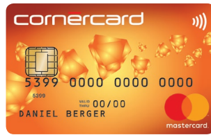
Cornercard Reload Orange Mastercard® 26/698/A62 PF: 26/703/A63