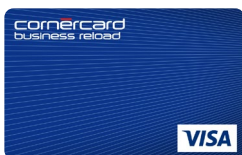
Cornercard Business Prepaid