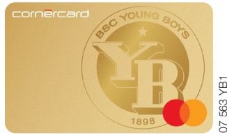
Cornercard YB Mastercard®

Ich profitiere vom Cornercard Angebot und wähle: