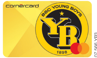
Cornercard YB Mastercard® Prepaidkarte*

Jahresbeitrag: Gold Kreditkarte CHF 90 Prepaidkarte CHF 0.