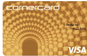
Cornercard Gold 01/001/A33 SC: 11367

Wichtig: Nur verfügbar, wenn die Platinum Hauptkarte in CHF ist.