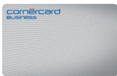
Cornercard Business Classic