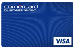
Cornercard Business Prepaid