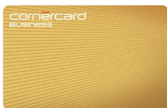
Cornercard Business Gold