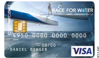
Race for Water Prepaid Visa Ref. 1374239607193 - 06/352/AF3

Important: veuillez remplir dûment le présent formulaire en lettres capitales et le renvoyer.