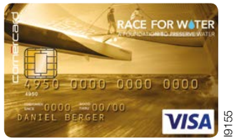
Race for Water Gold Visa Ref. 1374239757841 - 04/350/AF1