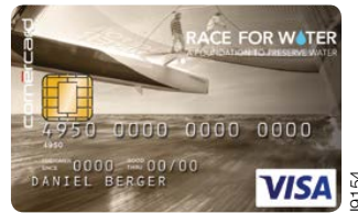
Race for Water Classic Visa Ref. 1374239706992 - 03/351/AF2