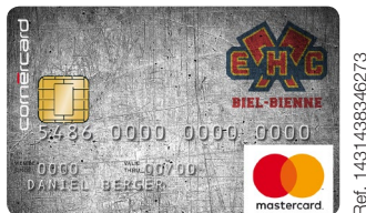
Cornercard EHC Biel Mastercard®

Carte de crédit CHF 40 la 1 re année au lieu di CHF 80.