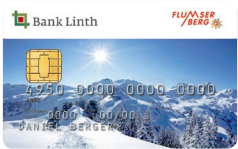
Special Design Flumserberg

VISA mastercard 1254921314617 1254923377742 (03/056/AV5) (22/056/AV7)