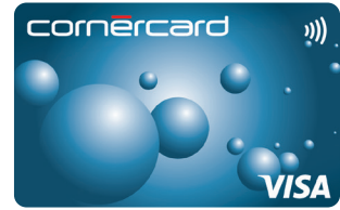
Cornercard Reload Blue Visa 06/698/A51 144/05/A51