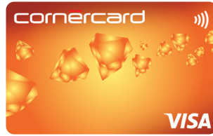
Cornercard Reload Orange Visa 06/698/A54 144/05/A54