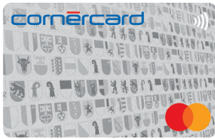
Cornercard Reload Silver Mastercard® 26/698/A58 134/05/A58