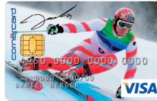
Ref. 1316505203258 Carlo Janka Visa Kreditkarte "Riesenslalom"

Kostenlose Mobility Option (Bitte eine Kopie Ihres Führerausweises beilegen).